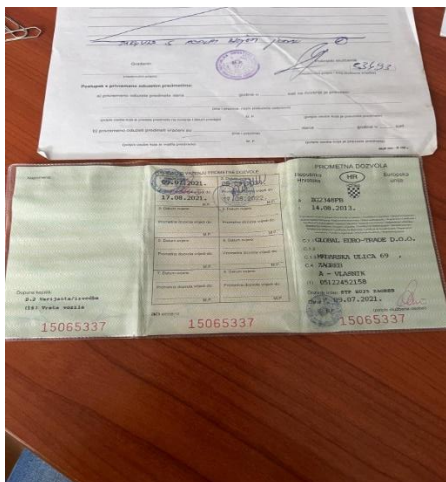
5. Peugeot Partner – prometna dozvola