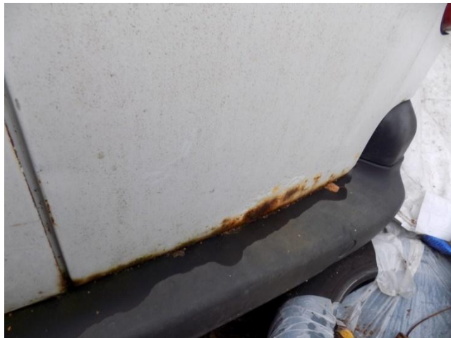
3. Peugeot Partner - pojava korozije