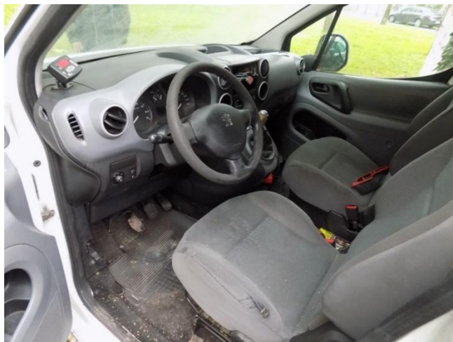
2. Peugeot Partner – unutrašnjost kabine