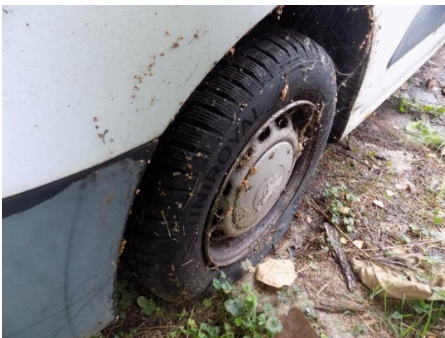
1. Peugeot Partner - stanje guma